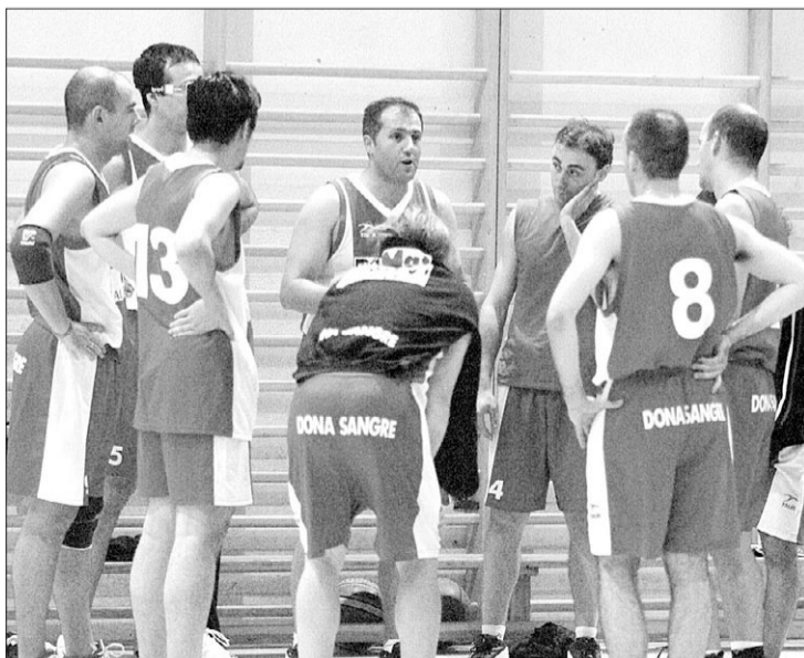
El Bigmat Alovera se acerca a la siguiente fase.

El segundo cuarto fue similar, los cambios en defensa del Bigmat termi-